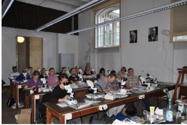
IPM Kurs im Naturkundemuseum Berlin 2014.