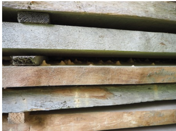
Fotos von Befall in einem Freilichtmuseum mit Holz und auch Figurinen.