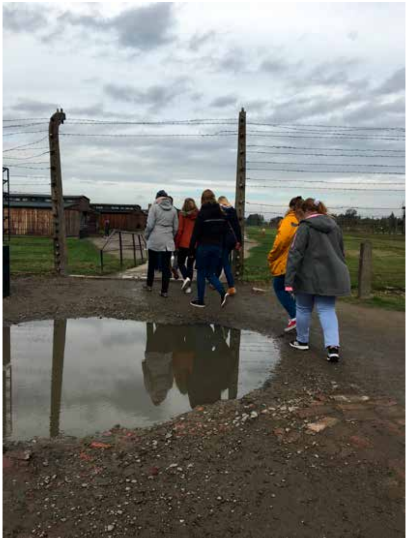
Im Sommer 2022 begleitete der Verein eine Studierendengruppe in die Gedenkstätte Auschwitz-Birkenau.

Ein weiteres Modul, das „Stories for tomorrow“ anbietet, befasst sich mit den unterschiedlichen Dimensionen von Antisemitismus, den historischen Wurzeln, aktuellen Formen und Handlungsoptionen. Denn Mausehelei, Mischpoke oder mosaischer Glaube sind Worte, die im Sprachschatz der Mehrheitsgesellschaft mehr oder weniger häufig und ohne groß darüber nachzudenken Verwendung finden. Nur wenige Nutzer*innen sind sich darüber bewusst, dass die Worte dem Jiddischen entlehnt sind. In der Regel haben sie keinen Bezug zum Judentum bei der Benutzung dieser und anderer Worte. In diesem Webinar geht es konkret um Idiome in der deutschen Sprache, die als antisemitisch definiert und auch von Jüd*innen so empfunden werden. Es bedeutet nicht automatisch, dass der Gebrauch der Worte auf eine antisemitische Einstellung hindeutet, doch müssen wir unsere eigene Sprache einmal kritisch betrachten. Das Modul behandelt eine kurze Einführung in einen sensiblen Umgang mit der eigenen Sprache sowie Handlungsoptionen und Tipps zu weiteren Materialien.