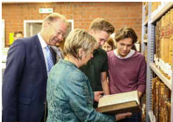
Sylvia Löhrmann besuchte 2016 gemeinsam mit Schülerinnen und Schülern des Gymnasiums an der Schweizer Allee das Wirtschaftsarchiv.