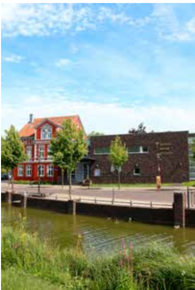
Das Jüdische Museum bietet seit über 30 Jahren Bildungsangebote für Lerngruppen an.

erzählt, die über den Kindertransport nach Schweden gerettet wurde. Ausgehend von der Beschäftigung mit dem Buch setzen sich die Kinder in diesem Zusammenhang mit unterschiedlichen Themen auseinander, die auch in ihrer Lebenswelt relevant sein können, wie zum Beispiel Migration, Flucht, Ausgrenzungserfahrungen und Heimat. Die Kinder werden darüber hinaus angeregt zu überlegen, wie sie sich selbst sehen und was sie ausmacht. Sie lernen, dass dieses Selbstbild und die eigene Identitätskonstruktion als Verfolgte*r im Nationalsozialismus keine Bedeutung hatten. Für Lehrkräfte haben wir einen Begleitband entwickelt, der zahlreiche Impulse und Anregungen für die Einbindung des Buches in den Unterricht bietet.