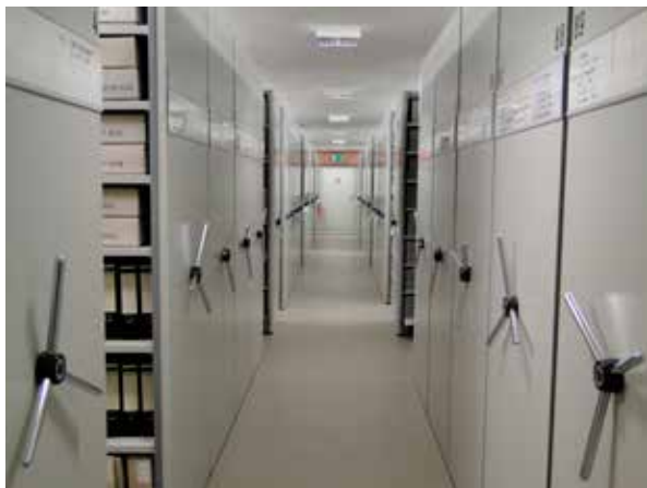
Eine Führung durch das Magazin des Archivs ist obligatorisch; Foto: WWA.

S2: „Die Atmosphäre im Wirtschaftsarchiv hat mich sehr beeindruckt.“