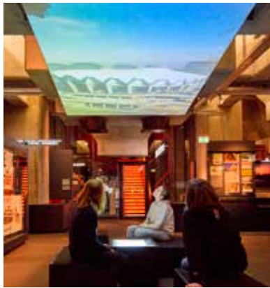
Schüler*innen in der Dauerausstellung des Ruhr Museums, © Ruhr Museum, Foto: Christoph Sebastian.

Der mit Blick auf das außerschulische Geschichtslernen größte Vorteil liegt in den oben genannten Bildungspartner*innen-Treffen. Diese einmal pro Schulhalbjahr stattfindenden