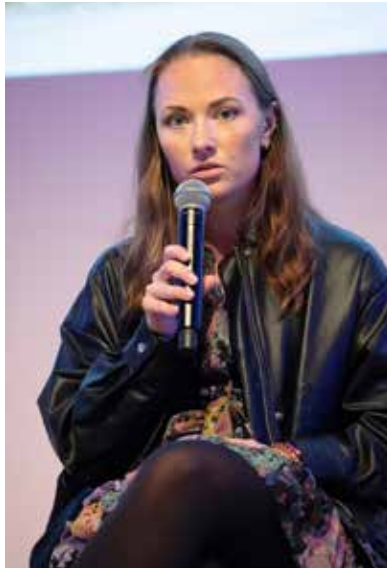
Isabelle Reckmann; Foto: Bettina Steinacker.

Abschließend zeigte der Austausch deutlich, dass angesichts der ständig steigenden Anzahl an Angeboten für Schulen