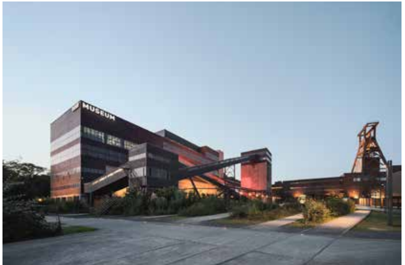
Das 2010 eröffnete Ruhr Museum zeigt in seiner Dauerausstellung über 6.000 Objekte, Copyright: © Ruhr Museum; Foto: Brigida González.

Dem hierdurch museal äußerst umfangreich aufgefächerten Themenspektrum wird ein ebenso umfangreiches Vermittlungsangebot in Form von Führungen, Workshops und Exkursionen zur Seite gestellt. Das separate „Programm für Schulen“ bietet Schulklassen Anknüpfungsmöglichkeiten an unterschiedlichste Inhaltsfelder der Kernlehrpläne für die Fächer Geschichte, Erdkunde, Biologie, Sachunterricht, Politik, Soziologie, Gesellschaftslehre und Deutsch. So lassen sich verschiedenste Aspekte der