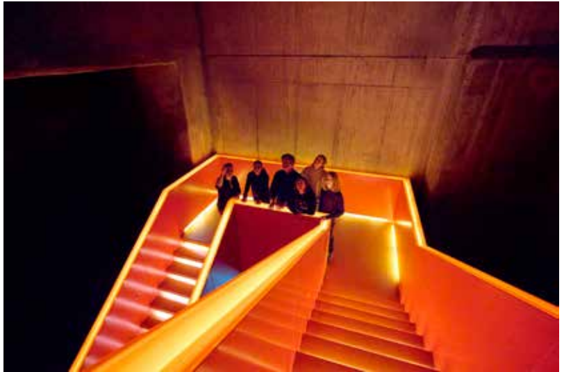
Schüler*innen auf dem Weg in die Dauerausstellung, © Ruhr Museum, Foto: Christoph Sebastian.

Die schriftlichen Kooperationsvereinbarungen formulieren für alle Schulen im Kern das gleiche Richtziel, nämlich die Entwicklung und Förderung der Informations- und Kulturkompetenz von Schüler*innen sowie den Ausbau und die Intensivierung der Zusammenarbeit zwischen den Partner*innen. Die Feinziele und vereinbarten Aktivitäten sind sehr individuelle Vereinbarungen, die auf die Bedürfnisse und Möglichkeiten der Schule abgestimmt sind. Beispielsweise hat sich eine Schule zum Ziel gesetzt, dass all ihre Schüler*innen im Laufe ihres Schullebens mindestens einmal das Ruhr Museum im Rahmen einer museumspädagogischen Veranstaltung besuchen. In einer anderen Kooperationsvereinbarung wird das Ziel formuliert, dass alle Schüler*innen jeweils in der Q1 eine museumspädagogisch begleitete Veranstaltung in der Dauerausstellung des Ruhr Museums oder ggf. in einer thematisch geeigneten Sonderausstellung besuchen. Eine andere Vereinbarung schreibt wesentlich mehr und konkretere Aktivitäten fest: Diese Schule plant, dass jeweils alle Klassen des Jahrgangs 7 den Workshop „Brief und Siegel im Mittelalter“, der