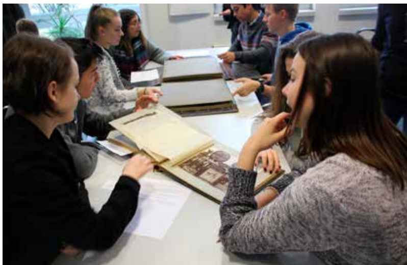
Mit Gästen aus der Partnerschule in Silves (Portugal) haben die Schülerinnen und Schüler 2017 im Archiv gearbeitet.

Neben diesen Archivbesuchen sind bisher einige Facharbeiten zusammen mit dem WWA entstanden, darunter eine zum Thema „Nationalsozialismus im Spiegel von Jubiläumsbänden Dortmunder Unternehmen“. Mitarbeitende des Archivs halfen außerdem dabei, geeignete Quellen zu den Themen „Wirtschaft im Nationalsozialismus“, „Weihnachten in Werkszeitschriften aus der NS-Zeit“ und „Ruhrbesatzung 1923“ für den Unterricht zu finden. Der von der Stiftung