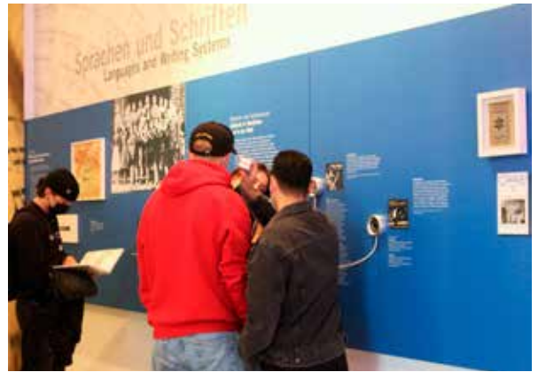
Jüdisches Leben als selbstverständlichen Bestandteil unserer Gesellschaft zu verstehen, ist ein wichtiger Aspekt der Vermittlungsarbeit, © JMW.