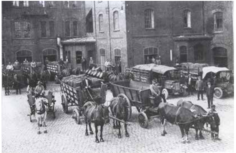
Unterricht mal anders: Auf den Spuren der Dortmunder Brauwirtschaft, Foto: WWA.

Eine Bildungspartnerschaft betrifft allerdings die ganze Schule, nicht nur die Fachschaft Geschichte. Welche Vorteile konnte also die Kooperation mit dem WWA unserer Schule bisher bieten? Zunächst wäre hier die Öffnung für die Zusammenarbeit mit außerschulischen Bildungspartnern als Element der Schulentwicklung zu nennen. 5 Die im WWA archivierten Bestände lassen sich inhalt-