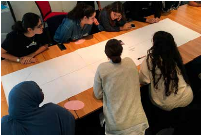
Gemeinsam entdecken, gemeinsam lernen, © Stories for tomorrow/Wencke Stegemann.

Die Forschung ist vor geraumer Zeit zu dem Konsens gelangt, dass Denkmuster und Strukturen, in die Menschen hineinsozialisiert werden, durch Sprache kategorisiert sind. Um rassistische und antisemitische Strukturen aufzubrechen, ist es daher unerlässlich, die eigene Sprache kritisch zu hinterfragen. „Stories for tomorrow“ schafft geschützte Räume, in denen Lernende ihre Sprache reflektieren und herausfinden können, wie sie mit anderen in Dialog treten können. In unterschiedlich angelegten Projekten können Schüler*innen biografisch und historisch arbeiten, erinnerungskulturelle Ansätze kennenlernen, professionell angeleitet über aktuelle politische und soziokultu-