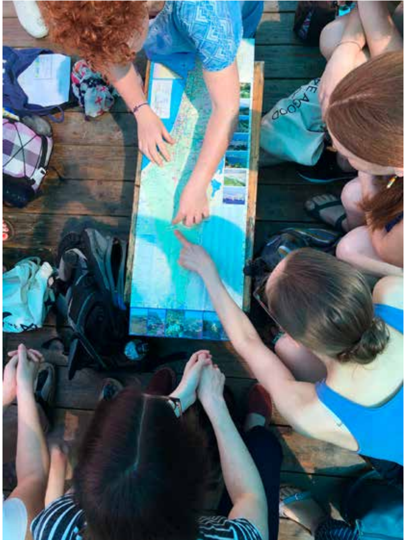
Ende 2022 erfolgte eine Studienreise nach Israel, © Stories for tomorrow/Wencke Stegemann.

Aus aktuellem Anlass ist auch das Modul „Israelbezogener Antisemitismus – definieren und erkennen“ von starker Relevanz. Diese heutzutage häufigste auftretende Form von Antisemitismus kommt aus unterschiedlichen Richtungen und mit unterschiedlichen Intentionen. Woran erkenne ich, dass es sich um Antisemitismus handelt und nicht bloß um Israelkritik? Um auf diese Frage eine objektive und nachhaltige Antwort zu finden, wird das Thema ausgehend von der Formulierung „Israelkritik“ bearbeitet. Wo die Trennlinien liegen, wird gemeinsam analysiert und Unterstützung beim Erkennen und Definieren geleistet. Darüber hinaus stehen der aktuelle Status im Konflikt zwischen Israelis und Palästinensern im Fokus sowie Erläuterungen zu historischen und aktuellen Problemlagen, um einen differenzierten Einblick zu geben. Denn Meinungen und vermeintliche Kenntnisse über diesen Konflikt sind in der Regel eng mit dem israelbezogenen Antisemitismus verbunden.