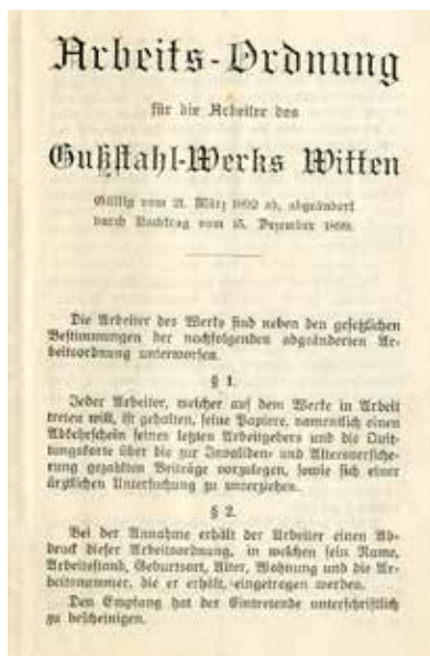
Regionalgeschichte zum Anfassen: Eine Arbeitsordnung aus den 1890er Jahren; Foto: WWA.

Die unterrichtliche Vorbereitung für den Archivbesuch besteht aus der Einführung in den historischen Kontext, der