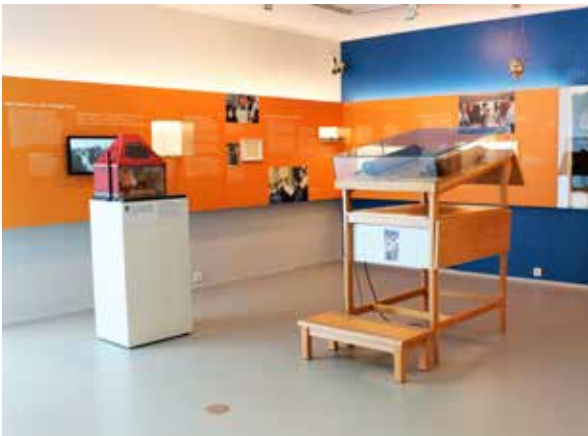
Die Dauerausstellung des Jüdischen Museums.