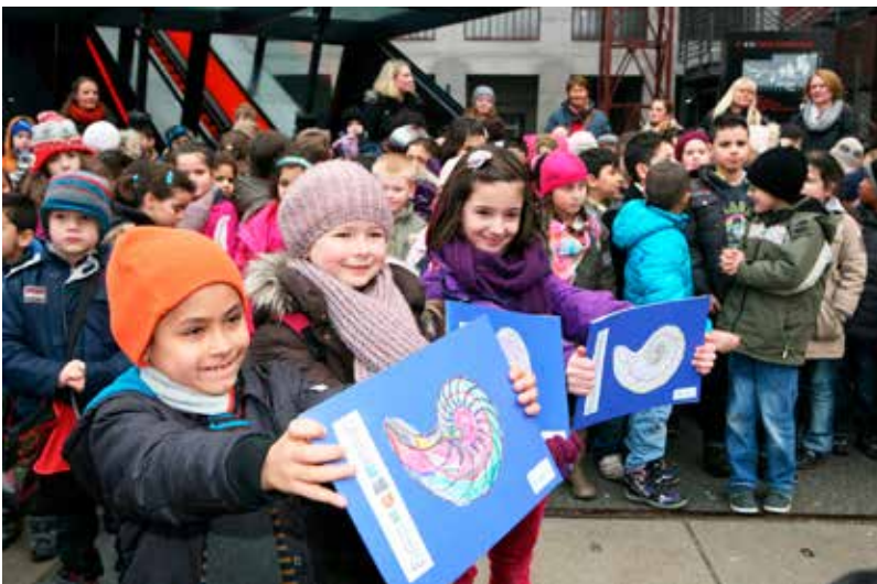
Schüler*innen der Karlschule überreichen ein Geschenk zur Bildungspartnerschaft, Copyright: © Ruhr Museum, Foto: Rainer Rothenberg.

In wenigen Fällen kam es nicht zu Verlängerungen der Kooperationsvereinbarung. Die erste, vor nunmehr 14 Jahren geschlossene Bildungspartner*innenschaft wurde bis heute regelmäßig verlängert und an die sich veränderten Bedingungen angepasst.