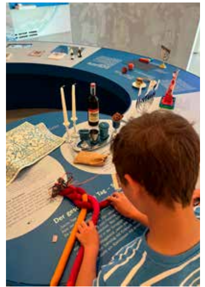
Das Thema „Jüdische Feiertage“ wird in Workshops zum Mitmachen thematisiert