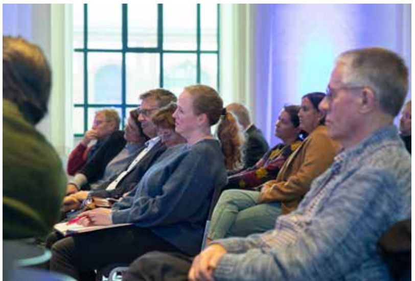
Zustimmendes Nicken im Publikum: Die Kommunikation zwischen Schulen und Kultureinrichtungen muss deutlich verbessert werden.

Communication is key – das betonen auf der anderen Seite aber auch die Vertreter*innen der Einrichtungen und sahen gleichsam die Lehrkräfte in der Pflicht, frühzeitig den Kontakt zu Museen und Gedenkstätten ihrer Wahl herzustellen. Sie plädierten für einen deutlich besseren Austausch vor Ablauf eines außerschulischen Lernprogramms. Ohne die entsprechenden Vorinformationen über die Lerngruppe kann das pädagogische Personal den Besuch nicht optimal vorbereiten und überlegen, welche konkreten Quellen oder Überreste gezeigt werden, ob kooperative Lernformen möglich oder unterstützende Zusatzmaterialien wichtig sind.